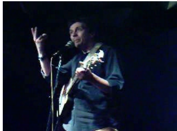
UN MOMENTO DELLO SHOW

Lo show si compone di due momenti fondamentali: la prima parte, nella quale vengono proposti esilaranti monologhi e dissacranti canzoni sulle tematiche più disparate, ivi compresa la cronaca nera, alla quale l'artista dedica alcune gustose parodie. Nella seconda parte lo show acquisisce una dimensione interattiva: infatti, a richiesta del pubblico, vengono cantate dapprima tutte le poesie della letteratura italiana sul tema di celebri canzoni e poi vengono improvvisate, su proposta del pubblico, canzoni in tutti i dialetti italiani e un blues in rima su parole richieste dalla platea.