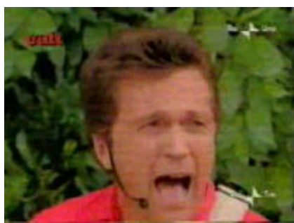
Su "BLOB" cult tratto da "Casaraiuno"