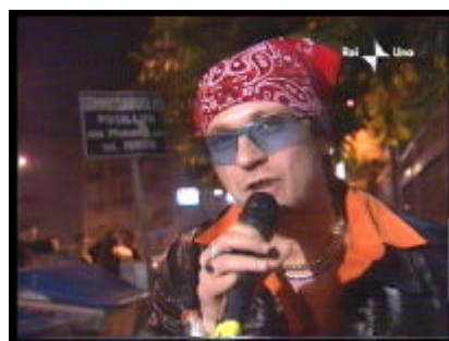
Su Raiuno in "Un pugno e una carezza"